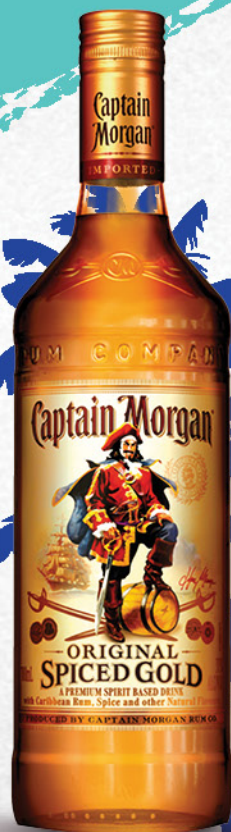
Captain Morgan Spiced Gold zlatni rum, 0,7l