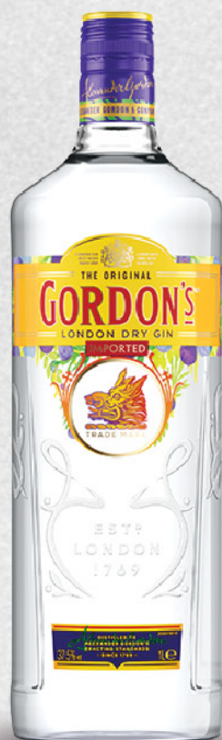
Gordon's dry gin, 1l