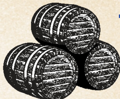
Needle Gin + San Pellegrino Tonic gin 0,5l + tonic 4/1, pak