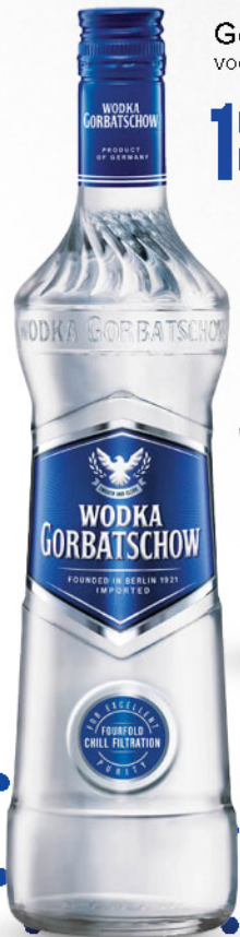
Gorbatschow vodka, 0,7l

Prvi kontakt donosi svježinu i mekoću, dok završetak ostaje čist, blag i elegantan. Savršeno se kombinira s citrusnim notama, tonikom ili premium miksovima, ali jednako impresionira i kada se pije samostalno. Bilo da obilježavate važne uspjehe, organizirate večernje druženje ili želite podići standard svakog posluživanja, vodka predstavlja simbol modernog luksuza i profinjenog ukusa.