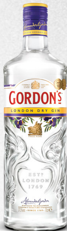
Gordon's dry gin, 0,7l