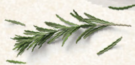
Jagdtraum biljni liker, 0,7l