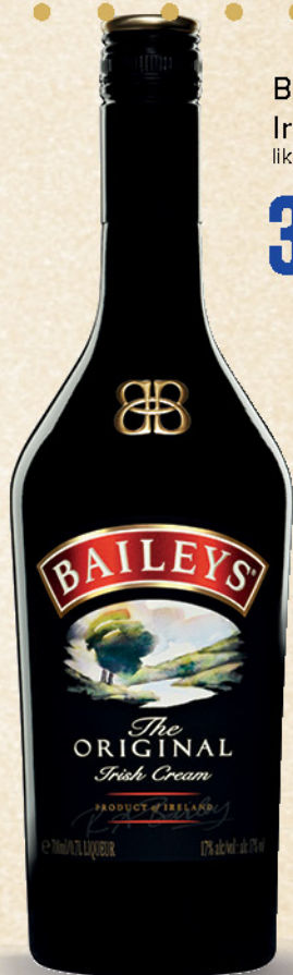
Baileys' Irish Cream liker, 0,7l