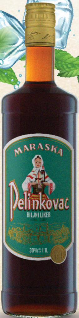
Pelinkovac biljni liker, Maraska, 1l