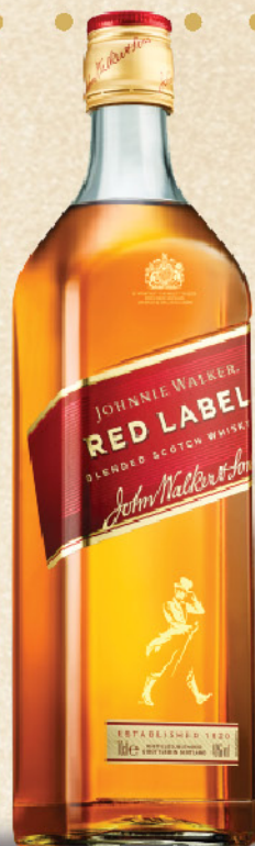
Johnnie Walker Red Label scotch whisky, 0,7l