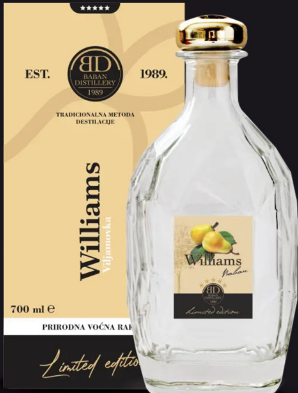
Williams Viljamovka rakija, Limited Edition, Baban, 0,7l