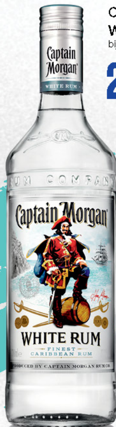
Captain Morgan White Rum bijeli rum, 0,7l