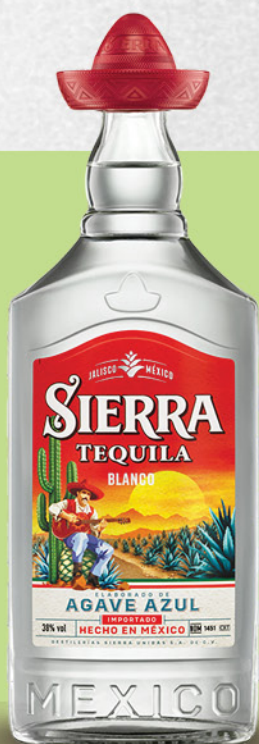
Sierra Tequila Blanco, 0,7l

Captain Morgan Original Spiced Gold predstavlja začinjeni zlatni rum bogatog i toplog ukusa. Karakteristične note vanile, smeđeg šećera, cimeta i drugih začina daju mu prepoznatljivu aromu i puniji karakter. Ovaj rum je posebno popularan u kombinaciji sa colom, ginger ale-om ili u zimskim i tropskim koktelima. Njegova zlatna boja i blago slatkasti završetak čine ga omiljenim izborom među ljubiteljima začinjenih alkoholnih pića.