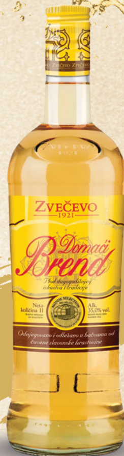
Domaći Brend brandy, Zvečevo, 1l