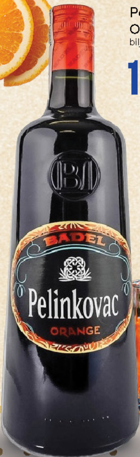
Pelinkovac Orange biljni liker, Badel, 1l