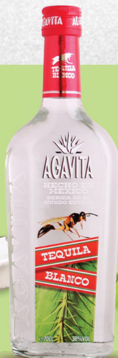
Agavita Tequila Blanco, 0,7l