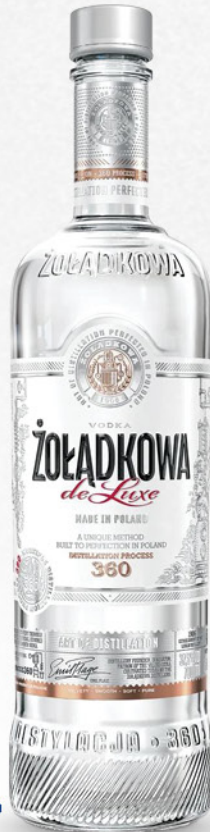
Żoladkowa deLuxe vodka, 0,7l