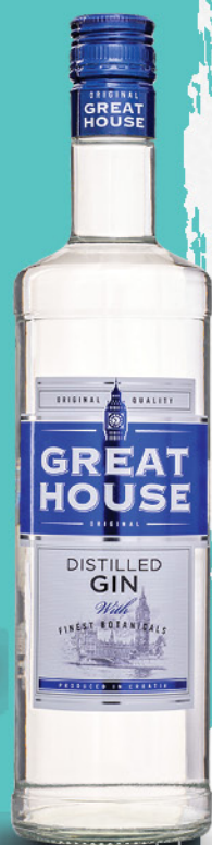
Great House gin, 0,7l