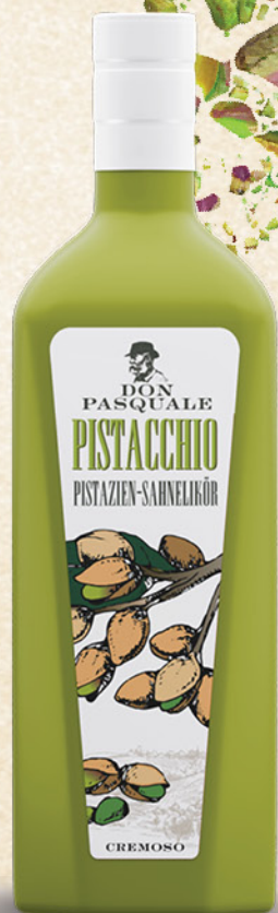
Don Pasquale Pistacchio liker, 0,7l