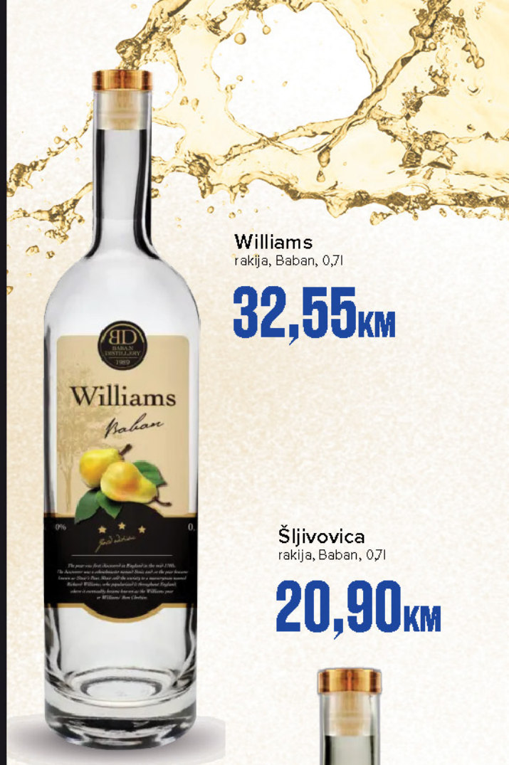
Williams rakija, Baban, 0,7l

U srcu tradicije, tamo gdje se priroda i zanat susreću, nastaju Baban rakije. Autentična domaća rakija vrhunskog kvaliteta, stvorena od pažljivo biranog voća i dugogodišnjeg iskustva. Svaka kap nosi bogatstvo ukusa, mirisa i karaktera koji podsjeća na prave vrijednosti domaće proizvodnje.