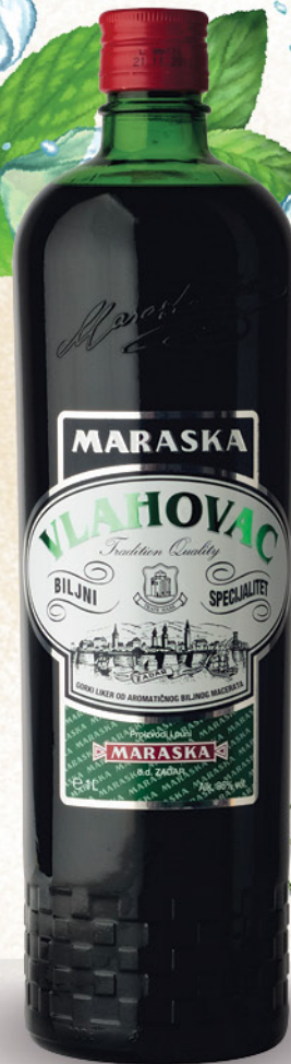
Vlahovac biljni liker, Maraska, 1l